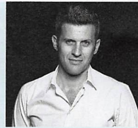
Links: Der Designer This Weber lebt und arbeitet in Zürich.